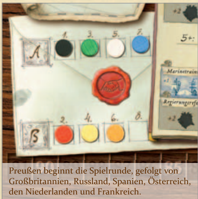
Preußen beginnt die Spielrunde, gefolgt von Großbritannien, Russland, Spanien, Österreich, den Niederlanden und Frankreich.

Reihe), beginnt die erste Phase einer Spielrunde. Es folgt der Spieler mit der Kontrollscheibe auf Feld 2 (das Feld am weitesten links in der unteren Reihe) usw., bis schließlich alle von Spielern geführten Nationen einmal an der Reihe waren. Die nicht von Spielern geführten Nationen werden in der Reihenfolge übersprungen. Alle folgenden Phasen der Spielrunde laufen gleich ab.