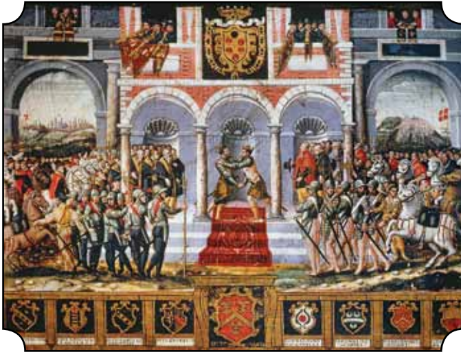
Der Frieden von Cateau-Cambrésis

Beim folgenden historischen Abriss sind alle fett gedruckten Persönlichkeiten, Ereignisse und Kunstwerke im Spiel als Spielstein oder Ereigniskarte zu finden.