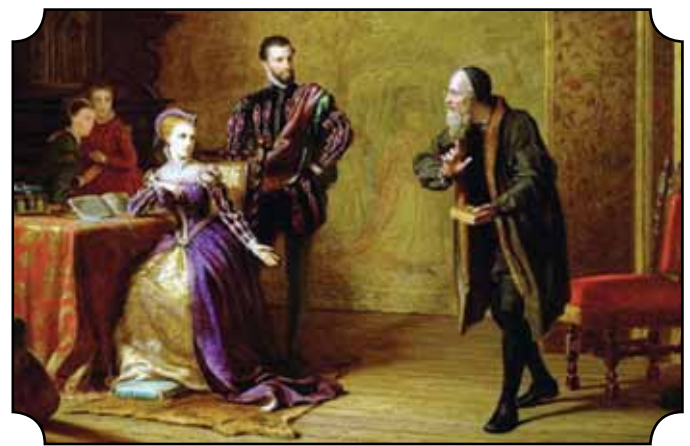
Maria Stuart und John Knox

Die neue Herrscherin über England, Marias Halbschwester Elisabeth I. , war ebenfalls im diplomatischen Heiratsspiel involviert. Eine Heirat mit Philipp II. wurde schnell abgelehnt, da Elisabeth gesehen hatte, wie abträglich die Verbindung mit Maria für England war. Es gab jedoch genügend andere Bewerber. Wie Katharina hatte die Tochter Heinrich VIII. und Anne Boleyn ein Reich übernommen, das religiös zerrissen war. In den vergangenen 30 Jahren war England vom Katholizismus zum Protestantismus und wieder zurück geschwenkt. Welche Religion würde Elisabeth sanktionieren?