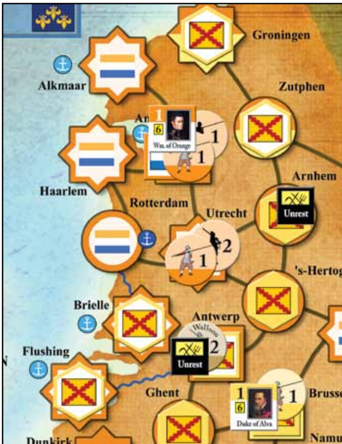
Die Situation nach dem protestantischen Impuls.

Die Spieler werden solange Karten spielen, bis sie alle in aufeinanderfolgenden Impulsen gepasst haben. Anschließend führen sie die Winterphase, die Heiratsphase, die Gönnerschaftsphase und die Gewinnermittlungsphase aus, um die Spielrunde abzuschließen.