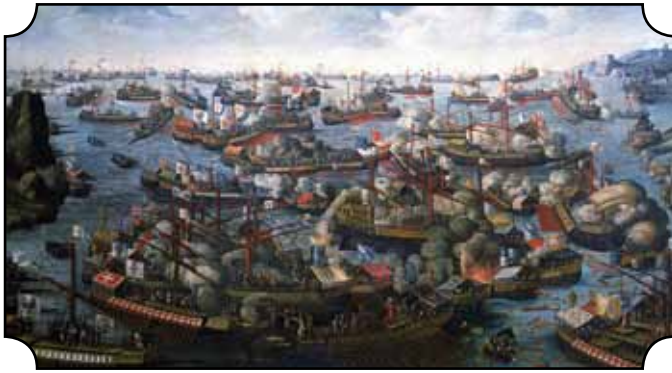
Seeschlacht von Lepanto