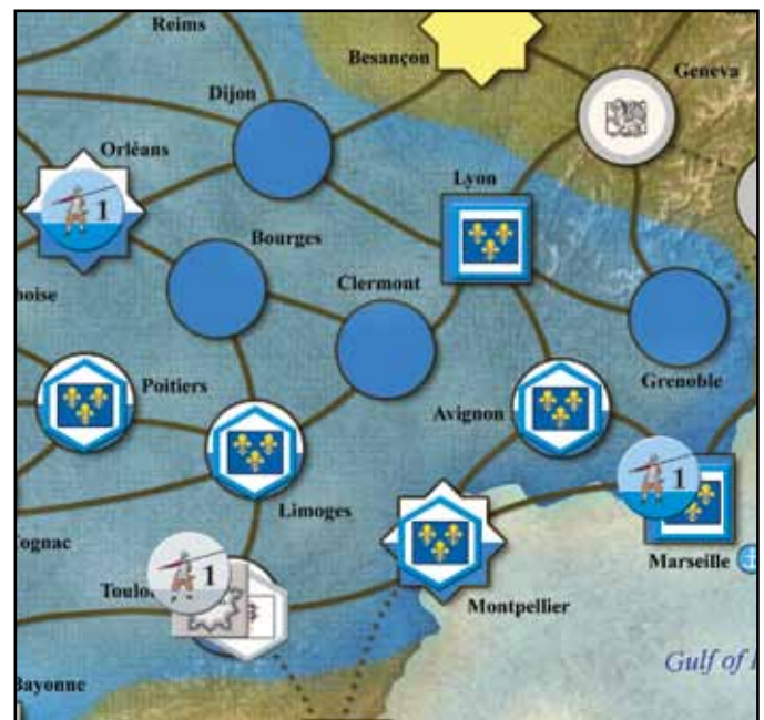
Die Situation nach Frankreichs Impuls.

BP 3: Es wird 1 Punkt diplomatischer Einfluss auf Venedig gespielt (ist nun 1). Frankreich plant immer noch, bis zum Ende der Runde Sultanin Safiye zu spielen. Dieser Einflusspunkt wird also bei der Statusbestimmung helfen.