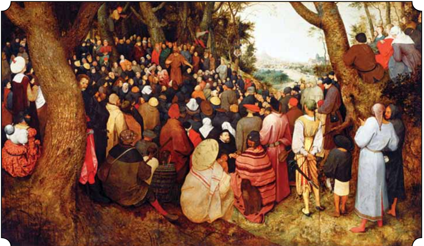
Predigt im Freien

Die englische Renaissance erreichte mit den Werken von Christopher Marlowe und William Shakespeare ihren Höhepunkt. Shakespeares Romeo und Julia wurde 1597 veröffentlicht. Einige bedeutende Werke liegen in der Zukunft: Der erste Teil von Miguel de Cervantes Roman Don Quixote erschien 1605. William Gilbert war zwei Jahre von der Veröffentlichung seiner Arbeit Über den Magneten entfernt, Johannes Kepler ein Jahrzehnt von der Fertigstellung der Keplerschen Gesetze der Planetenbewegung (die Daten waren bereits mehrere Jahrzehnte zuvor von Tycho Brahe zusammengestellt worden). Das Zeitalter der Renaissance neigte sich dem Ende zu, der Barock zog herauf.