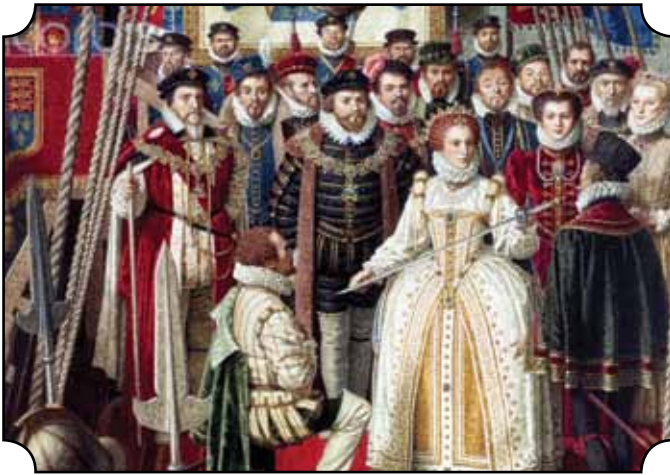
Drake kehrt zurück