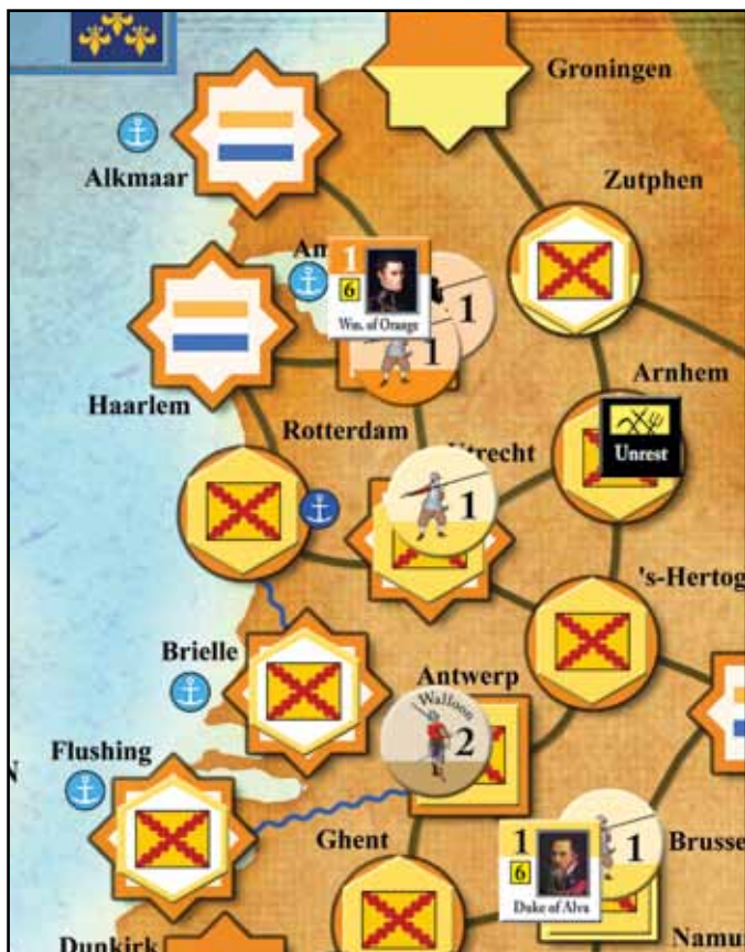
Die Situation nach dem protestantischen Impuls.