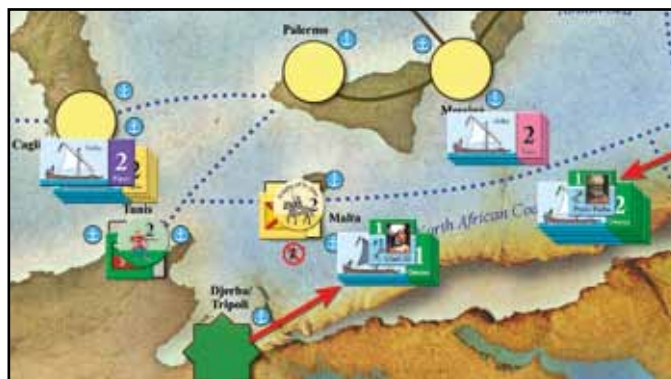
Die Situation nach dem osmanischen Impuls.

BP 5: Es wird 1 Söldner in Amsterdam ausgehoben.