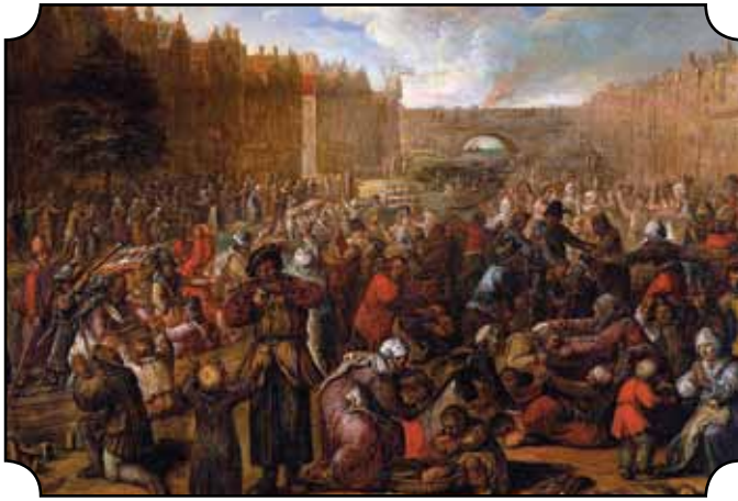
Der 80jährige Krieg beginnt