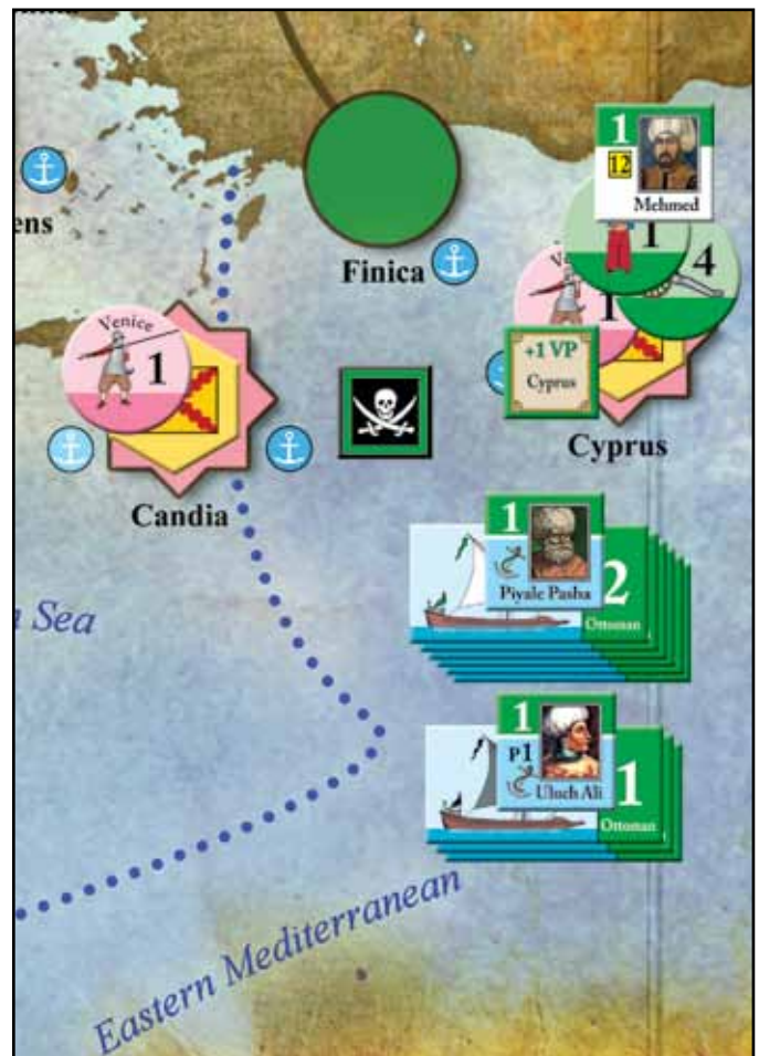
Die Situation nach dem osmanischen Impuls.

BP 4-5: Seetransport von Sokollu Mehmed und 5 Regulären nach Cyprus, um dort zu belagern.