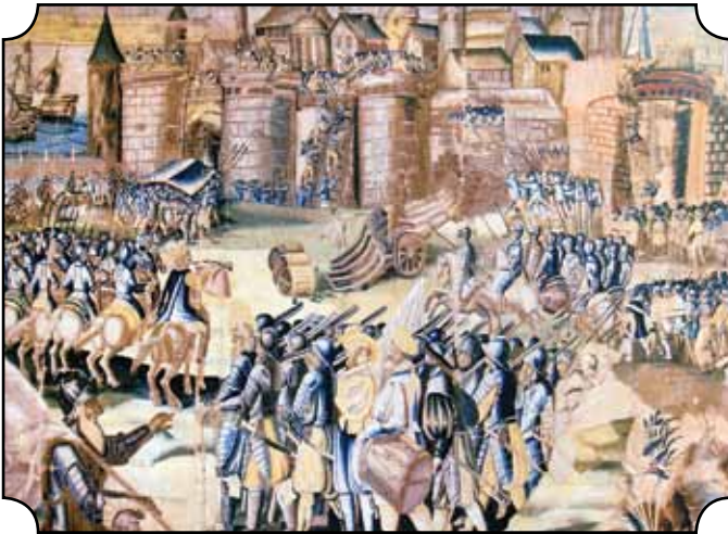
Die Belagerung von La Rochelle