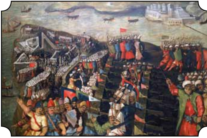
Die Belagerung Maltas