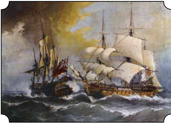
Race built Galeonen im Kampf gegen spanische Galeonen